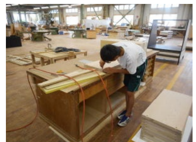
職場体験学習 (作業に取り組む様子)

10月1日(水)、1年生は職場訪問に出かけました。10の事業所を訪れ、事業所の概要や仕事の内容を説明していただいた後、インタビュー形式で、仕事への思いや中学生へのアドバイスなどを聞かせていただきました。職場に出向き働く方々の生の声を聞かせていただくことで、生徒は多くのことを学びました。