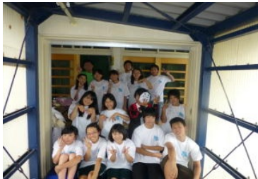
七恵まつりでお化け屋敷 を行った皆さん

9月15日(月)敬老の日、長浜コミュニティセンターにおいて長浜地区敬老大会が開催され、合唱部10名が出演しました。曲は、北酒場、喝采、花嫁など昭和の懐かしい歌謡曲ばかりで、参加した皆様に楽しんでいただきました。