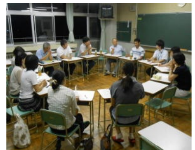
浜山中の子どもを語る会

7月10日(木)、浜山中の子どもを語る会を行い、100名を超える保護者の皆様に参加いただきました。始めに全体会を行い、その後高松・長浜の学年ごとに分かれて、スマホやLINEの使い方やルールなどについて意見交換を行いました。