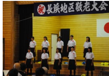
長浜地区敬老大会に出演 する合唱部