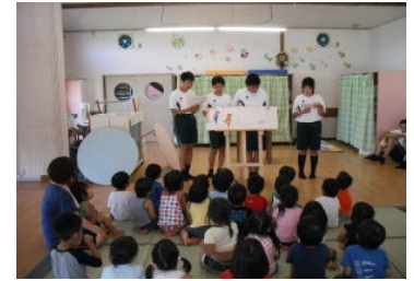
放送部の荒茅保育園訪問