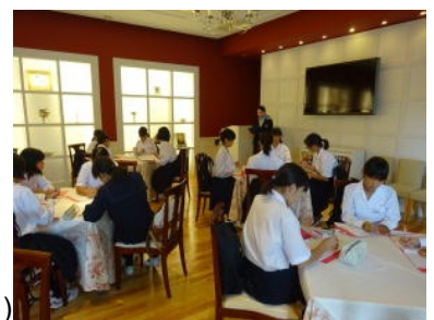
職場訪問学習(研修の様子)