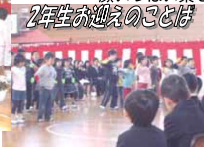
2年生お迎えのことば