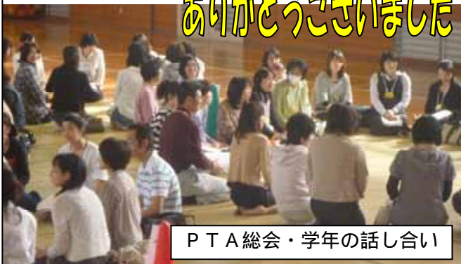
P T A総会・学年の話し合い