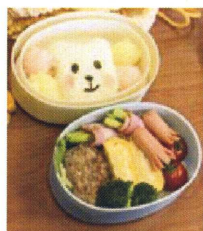
←3年生の作品 1回目からキャラ弁登場