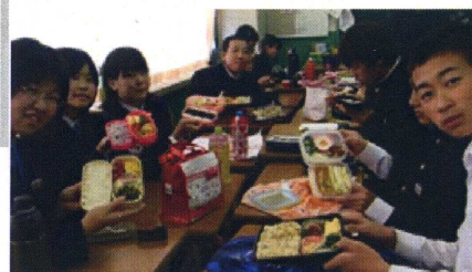
↑弁当を傾け上手にポーズ 2年生

朝早くから台所に立った子どもたちにドキドキさせられたことと思いますが、多くの保護者の方がこの「弁当の日」のもつ効果を感じてくださったようです。生徒たちも自分が苦労した分、それを親の苦労に重ね合わせることができ、多くの方が「感謝」という言葉を感想文の中に書いていました。