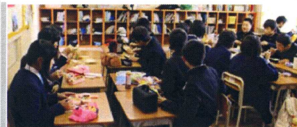
↑3年生の会食の様子

朝の忙しい時間帯に、他の家族のお弁当や朝食の準備と重なり、どうなることかと思いましたが、前夜の下準備、当日の早起き、大らかな気持ちで見守った母のおかげで満足のいくお弁当づくりができたようです。自分で作ってみることで、日頃あまり実感することのない、大変さ、ありがたみ、食の大切さ等、考えさせられたことでしょう。次回は今回とはちがうメニューで挑戦してみるのも良いと思います。自分の自信にもつながっていい勉強になったようです。(保護者の感想より)