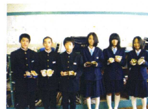
↑1年生は班ごとに撮影