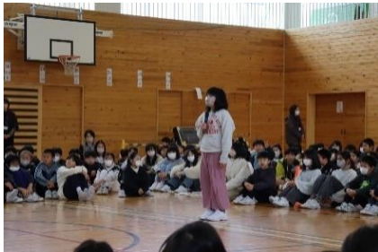
実行委員会終わりのあいさつ