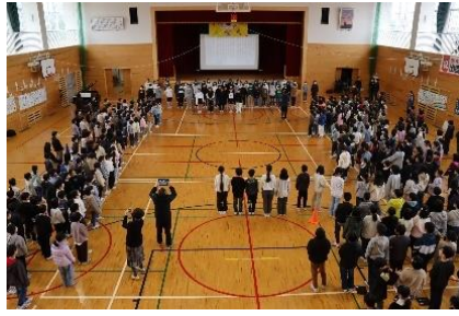
全校合唱「明日へつなぐもの」