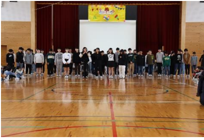
6年生のお礼の出し物