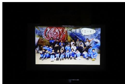
思い出のアルバム(5年生作成)