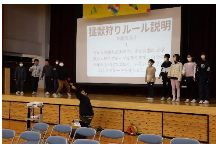
全校ゲーム(猛獣狩り)