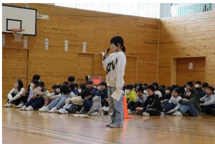
実行委員会はじめのあいさつ