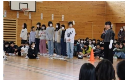
実行委員会1～4年生へお礼のあいさつ