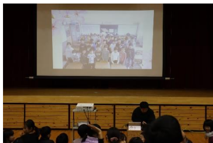
感謝のメッセージ動画